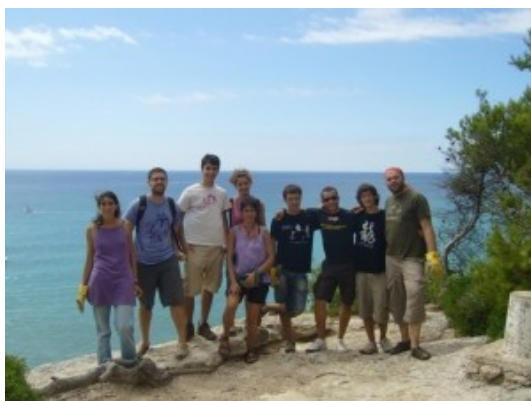
Grup d'escoltes de Martorell acompanyats per membres de DEPANA

Al llarg de l'estiu, diferents persones col·laboren a títol voluntari en la conservació i millora d'aquest espai natural de Tarragona, en el que DEPANA hi és present des de fa més de 10 anys.